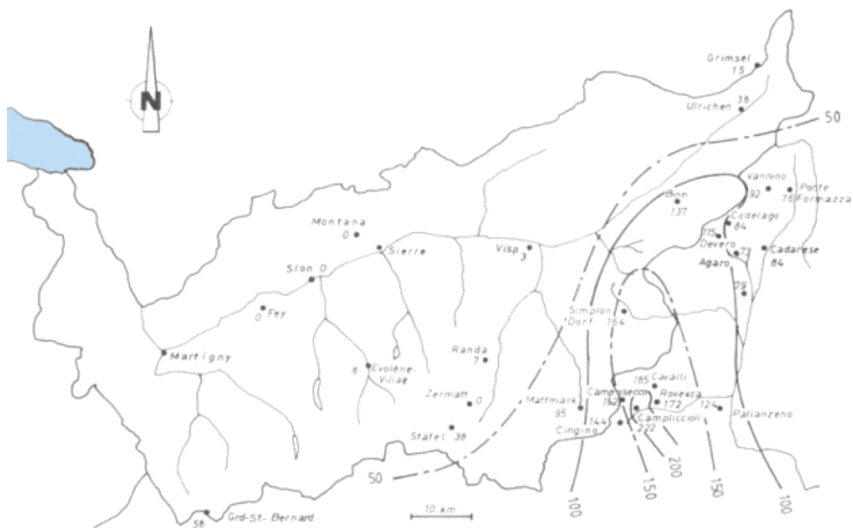
Fig. 2. Carte des isolignes des précipitations tombées sur le massif du Simplon, basée sur la somme des précipitations du jeudi 22 au samedi 24 septembre 1994 (je 7h30 - di 7h30). [Echelle en mm]. [CRSFA, 1994b]

Cette carte isohyète de 1994 présente une troublante similitude de forme avec celle tracée lors des intempéries de septembre 1993. Le scénario d'une perturbation importante s'infiltrant le long de l'arête Weissmies-Fletschhorn en direction du massif du Simplon peut à nouveau être proposé. L'intensité des précipitations en 1994 furent toutefois nettement moindres qu'en 1993.