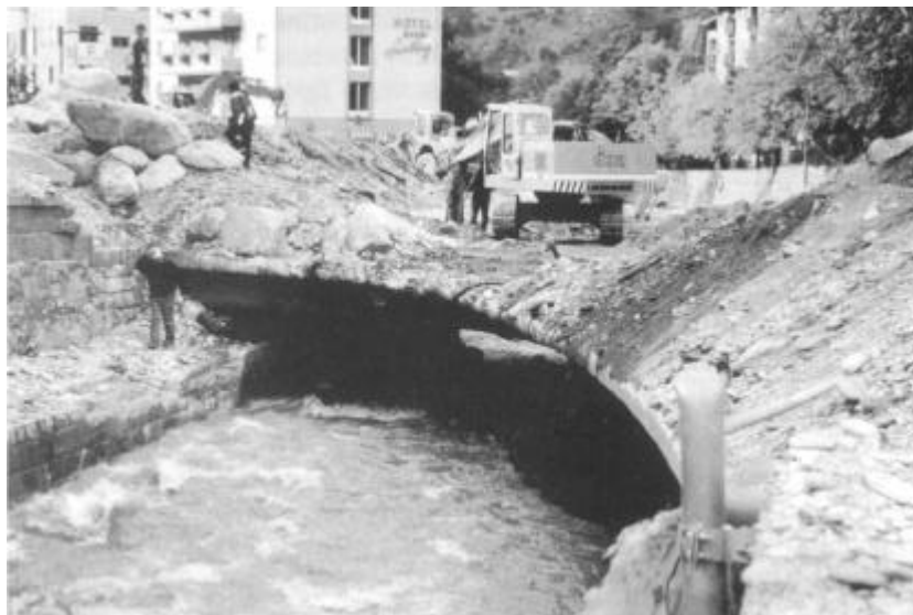
Photo 1. Vue de la bordure amont du pont de la Saltina, situé au sommet de la ville de Brigue, pendant les travaux de déblaiement. Il faut relever la taille importante de certains blocs de rocher charriés par la crue, ainsi que la faible hauteur d'écoulement sous le tablier du pont.