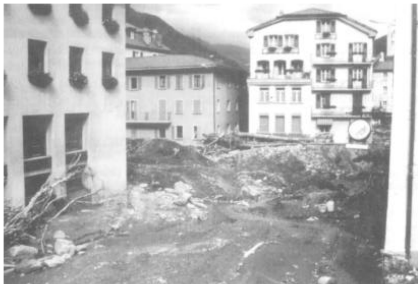
Photo 2. Débris déposés par la crue dans la partie supérieure de la ville de Brigue de la Saltina, à proximité du débordement du pont: quartier Marktplatz-Sebastianplatz. Les matériaux se sont accumulés jusqu'au niveau du premier étage des immeubles.

Le précédent cas de débordement s'était produit en 1927. Dans des conditions météorologiques similaires à celles de 1993, une nouvelle crue a menacé Brigue en septembre 1994, soit exactement un an après. Ceci permet de confirmer l'inquiétude des habitants de la ville sur leur sort !